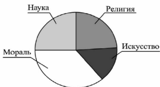
Влияние различных областей культуры на духовный мир личности

Найдите в приведённом списке выводы, которые можно сделать на основе диаграммы, и запишите цифры, под которыми они указаны.